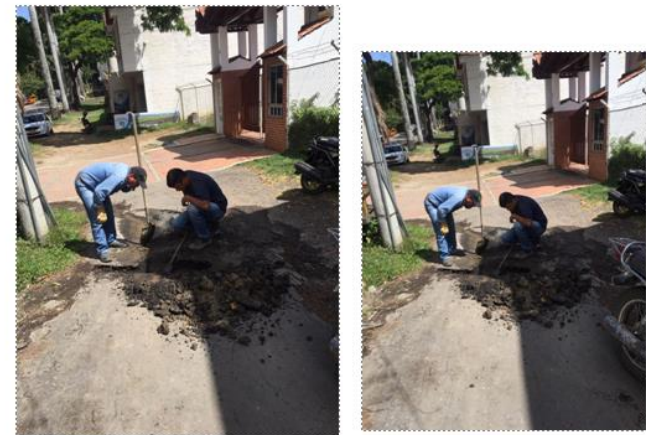
Arreglo domiciliar de 1" 2 mts en el barrio bello horizonte