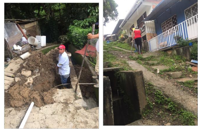
Reposición de 6mts de tubo de 2" en el barrio mirador