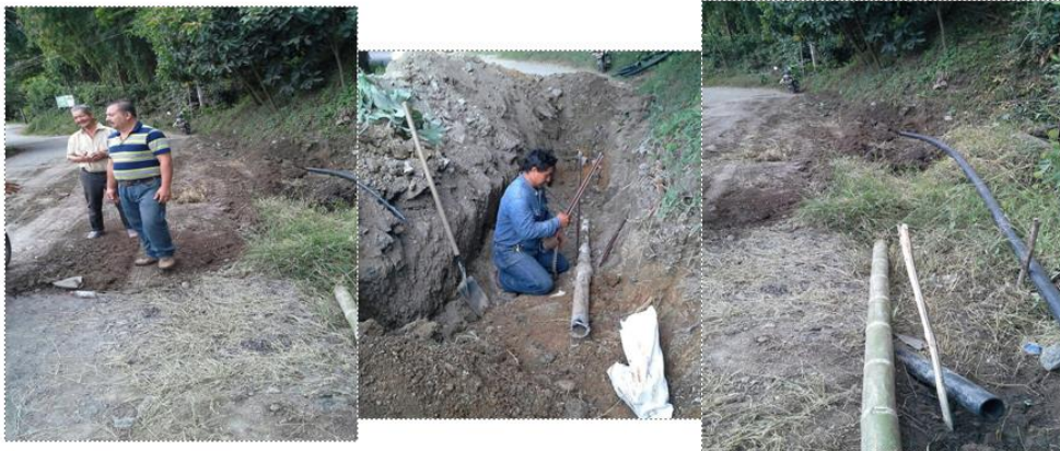
Reposición de 15mts de manguera de 3" PD en el sector paso malo